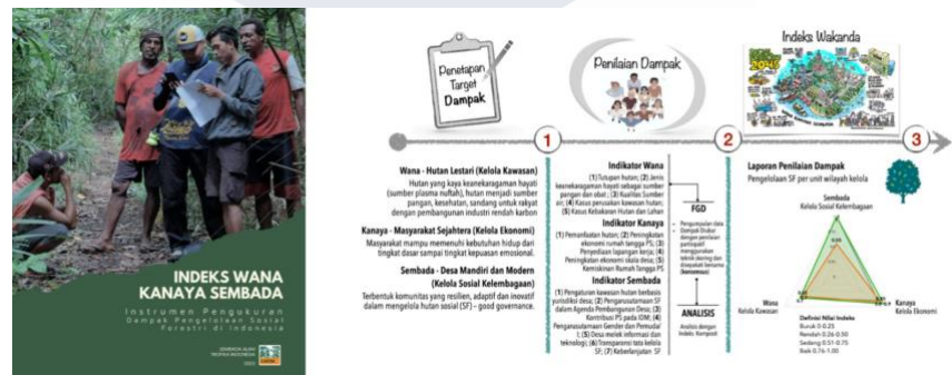
Gambar 2. 3 Indeks WAKANDA