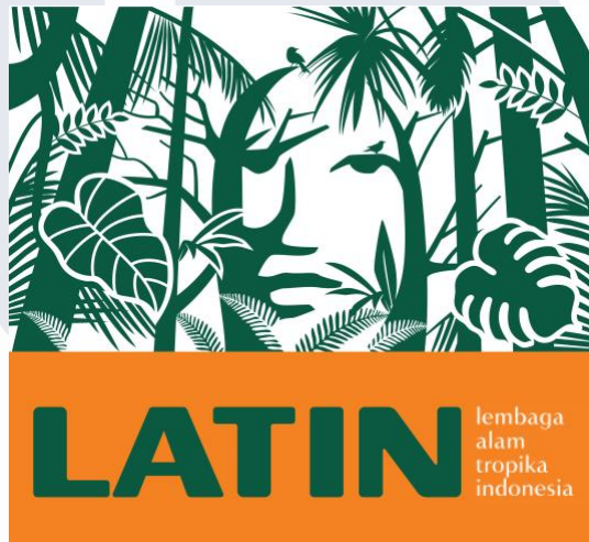
Gambar 2. 1 Logo LATIN